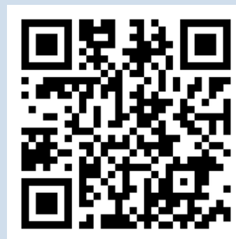
Website QR Code